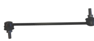
スタビライザーリンク