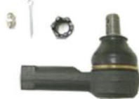
タイロッドエンド