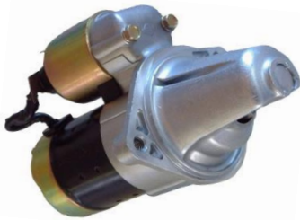
スターターモーター