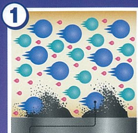
① 洗浄剤 汚れをマイクロに分解

「エンジン クリーン」に配合された「洗浄剤」が汚れをマイクロに分解し、「分散剤」が汚れをオイル中に分散させ、再付着を防ぎます。また、「劣化防止剤」の働きでエンジンオイルの劣化を抑え、オイル性能を保ちながら、次回のオイル交換までエンジン内部の汚れをじっくり落とします。